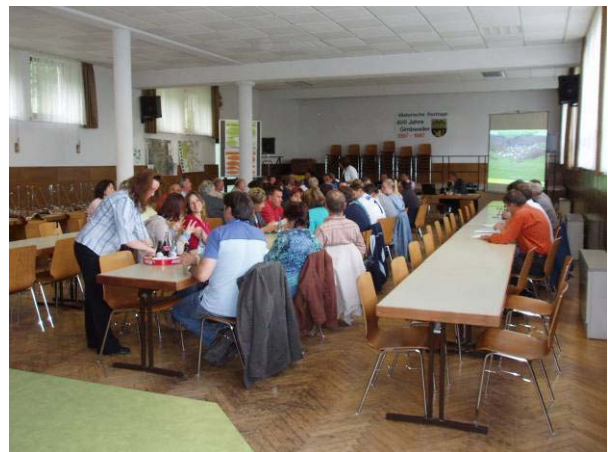
Impressionen der Auftaktveranstaltung