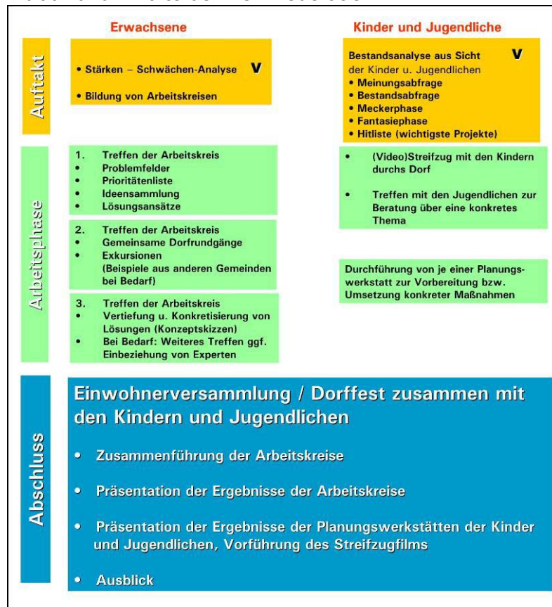
schematische Darstellung des geplanten Ablaufs der Dorfmoderation in Gimbweiler